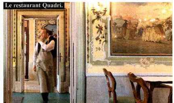
Le restaurant Quadri.

petits artichauts crus de Sant' Erasmo vendus tout épluchés, et d'une foule de salades et légumes inconnus de ce côté-ci des Alpes (haricots rares, puntarelle , cime di rapa ...). Ouvert tous les jours.