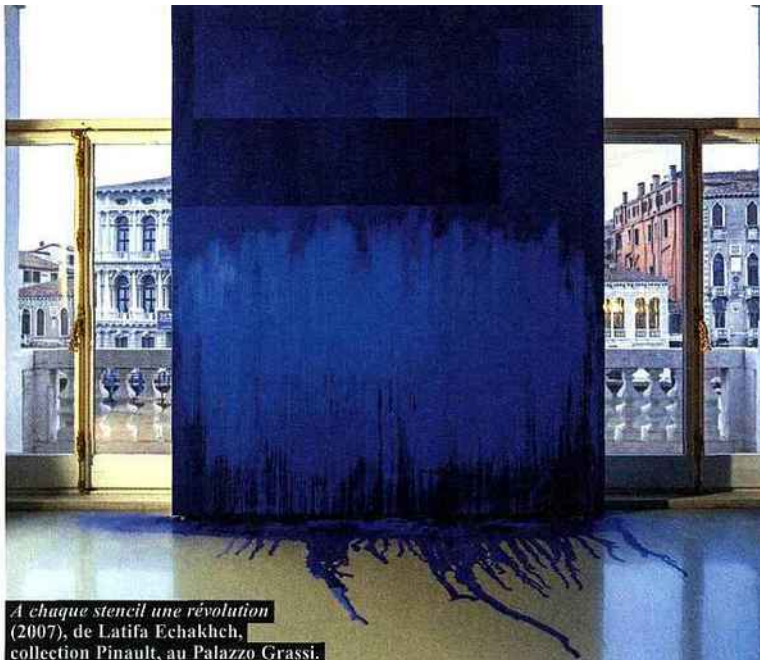
A chaque stencil une révolution (2007), de Latifa Echakhch, collection Pinault, au Palazzo Grassi.