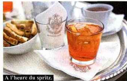
A l'heure du spritz.